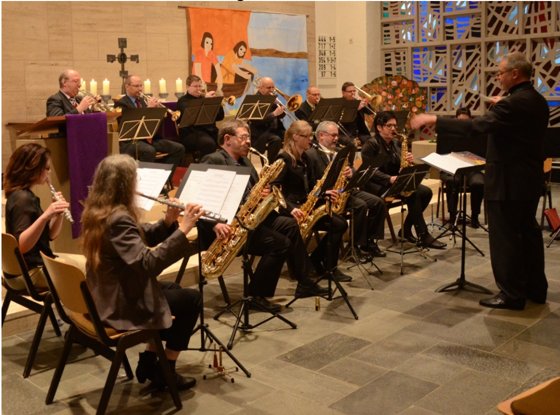
Musikverein Algenrodt e.V., Bild von 2014

Herzliche Einladung zum Konzert mit dem Musikverein Algenrodt e. V., in der Kirche St. Joh. Nepomuk Kirchenbollenbach, am Sonntag, den 6. Mai, Beginn 17.00 Uhr, der Eintritt ist frei.